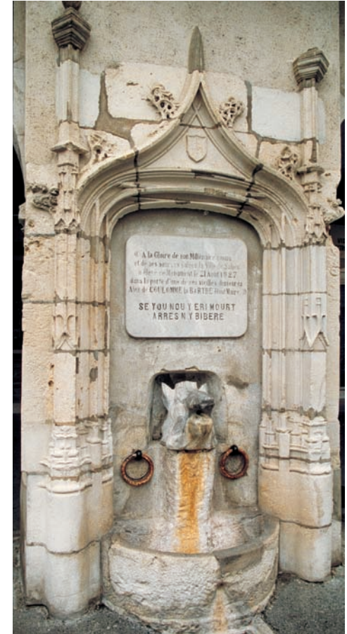
La Fontaine Salée, place du Bayàa.