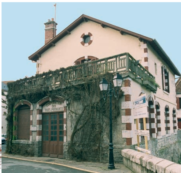
Immeuble Place de la Trompe