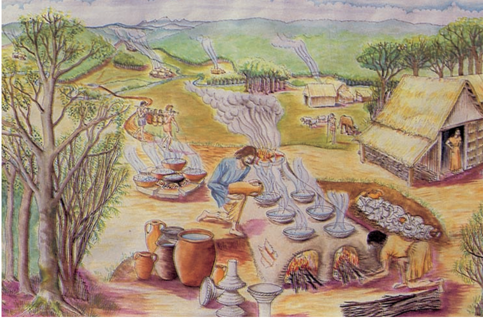
Reconstitution du fourneau à sel de Mosqueros (I er -II e siècles).