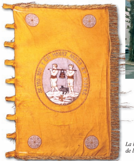
La bannière de la Communauté du sel