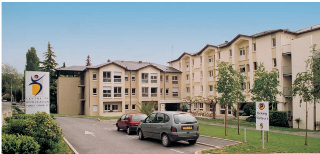
Centre de Rééducation Fonctionnelle