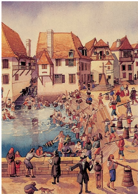
Aquarelle des "Amis du Vieux Salies"

CORPORATION DES PART-PRENANTS DE LA FONTAINE SALÉE MAIRIE – 64270 SALIES-DE-BÉARN www.salies-de-bearn.fr – www.thermes-de-salies.com