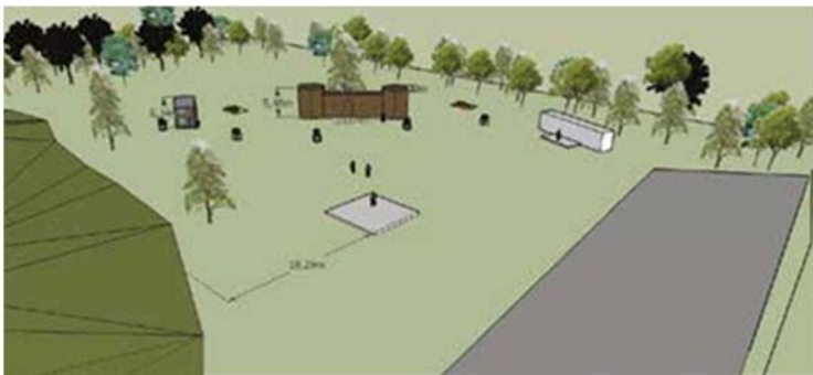
Plan de la mise en scène dans le parc de Beauvais à Romorantin.